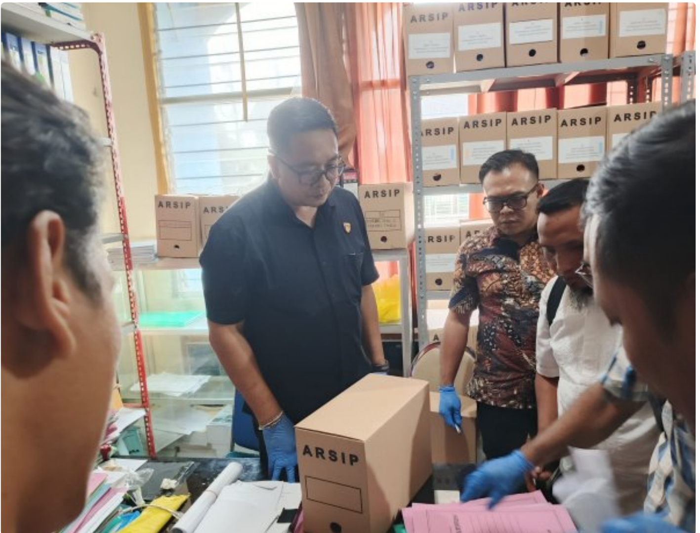
Saat Penggeledahan di Dikbud NTB, Jumat (13/12/2024)